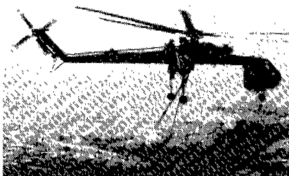
소방용헬리콥터가 물을 운반하고있다.