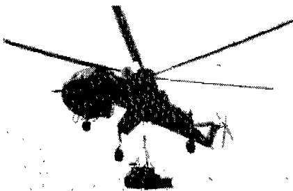
중량물을 운반하는 헬리콥터

게다가 헬리콥터는 머리위에 길고 육중한 로터가 돌고 있어 기상조건에 영향을 받기 쉬운 취약성이 있다. 그리고 속도면에서도 시속 300km를 넘지 못하여 독일, 프랑스, 일본의 고속전철 정도인 점등이 대중 수송용으로 쓰이지 않은 원인으로 꼽힐 수도 있는것 같다고 전문가들은 말하고 있다.