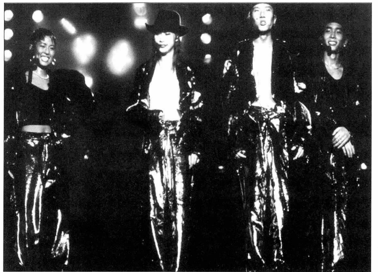
90년대를 분기점으로 대중음악의 크리티시즘이 발화하기 시작한다. 사진은 '롤라'의 공연 모습.

게 파악할 것인가? 무비판적 추수? 아니면 문화제국주의라는 무자비한 딱지? 이제 이 지배적인 문화양식에 대해 우리에게 필요한 것은 보다 많은 정보가 아니라 보다 균형이 잡힌 관점이다.