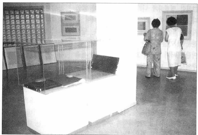
색지를 능화판 위에 놓고 밀랍을 칠한 뒤 밀돌로 힘껏 문지르면 각각의 문양이 도드라지듯 새겨진다. (학교재 전시장 모습)

그밖에 나비나 박쥐 같은 곤충, 동물문양도 있는데 나비는 흔히 국화무늬와 함께 나타나고, 용이나 학은 구름무늬와 어우러진