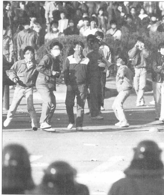
한국학생운동은 그 강한 영향력에 비해 아직 연구는 걸음마 단계이다.

학생운동 내부에서 잉태된 논쟁들을 시기별로 정리해 놓은 책도 있다. 《학생운동논쟁사 1·2》(김광 외, 일송정)가 그것으로 제1권에서는 70년대 중반부터 87년까지의 논쟁들을 자료를 중심으로 정리했다. 88년 이후부터 90년까지의 논쟁을 정리한 제2권에서 이른바 '주사파'라 불리는 주체사상과 마르크스·레닌주의와의 논쟁이 핵심으로 부각된다. 통일노선, 페레스트로이카와 동구변혁 등 당시의 상황을 해석하는 이론과 이를 바탕으로 하는 실천적