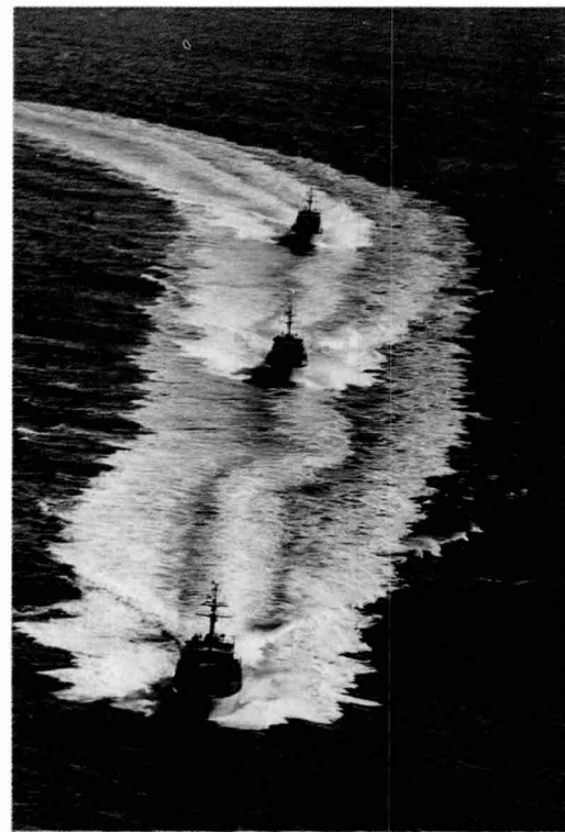
◀ 훈련에 참가한 209급 장보고 잠수함