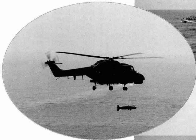
▲ 대함 및 대잠전, 주요항만방어 및 긴급수송, 정찰 감시 등을 위해 도입된 LYNX 헬기로 부터 발사되는 Sea-Skua 공대함 미사일