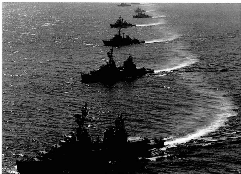
◀ 해상 및 항공사열 모습. 해군 고유의 전통으로 함정, 항공기, 잠수함 등 모든 세력이 참가하여 상급 지휘관에 대한 경의와 필승의 신념을 나타낸다.