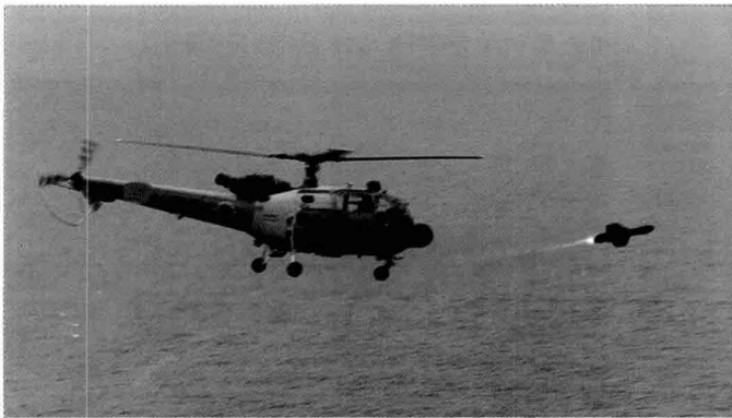
▲ 피아식별장치(IFF), 탐지장비(MAD)를 탑재한 ALT-III 헬기로부터 발사되는 AS-12 공대함 미사일

해군은 광복직후 45년 「海防兵團」이란 이름으로 창건된 이래, 93년 독일에서 잠수함을 도입할 전배치하였고, 올해 P-3C를 도입하였으며, 오는 97년까지 3천톤급 한국형 구축함(KDX)을 국내 건조할 계획으로 명실공히 최첨단 무기체계에 의한 수중, 수상, 공중에서의 입체전력을 구축해 대양해군으로 발돋움할 계획이다.