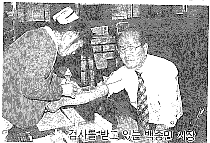
검사를 받고 있는 백종민 시장

이지사와 백수원시장은 또 검사를 마친 후 이순 사무국장으로부터 지부 사업 현황에 대한 보고를 받고, 주민 건강관리에 힘쓰는 직원들의 노고를 치하했다.