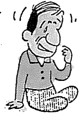
기쁘지도 슬프지도 않은 사소한 일에 자극을 받아서 격하게 웃거나 운다.