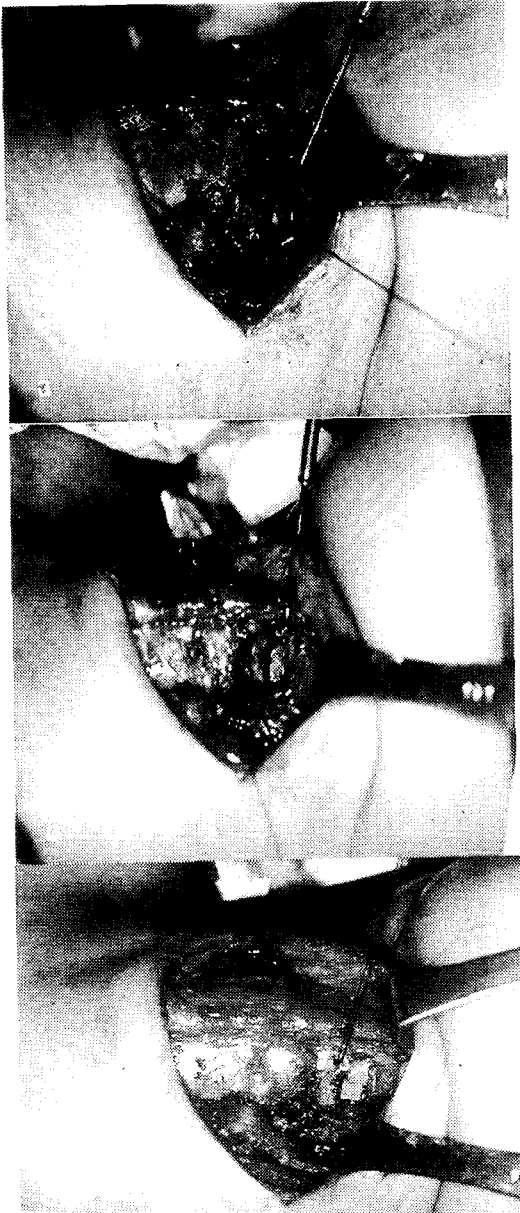
Fig. 3. Operative findings. a) After the muscular process of arytenoid cartilage was identified, 2 sutures(4. 0 nylon) were passed through it. b) The window (arrow) was made 4mm high and 8mm wide on thyroid ala. c) After the suture connecting the muscular process to the thyroid ala was tied, the silicone block was placed over the window.

앞쪽선이 되어 4×8mm 크기로 전기톱을 이용하여 갑상연골을 제거하여 직사각형의 창을 만들었다(Fig. 3-b). 이 때 갑상연골의 내연골막이 손상받지 않도록 주의하였다. 고안한 실리콘조각을 창을 통해 삽입하여 성대가 내측으로 전위되도록 하겠다고 전의 nylon su-