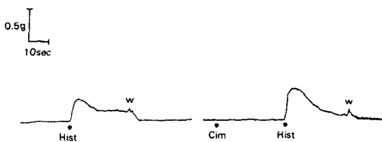
Fig 3. Effect of H_2 -histaminergic receptor blocker, cimetidine(Cim. 10^{-6} M) on contractile response induced by histamine (Hist. 10^{-6} M) on the uterine smooth muscle of pig.

돼지 자궁 평활근에서 histamine에 수축효과가 H_2 -histaminergic receptor와는 어떤 관계가 있는지를 관찰하기 위하여 H_2 -histaminergic receptor 차단제인 cimetidine( 10^{-6} M)을 전 처리하고 5분 뒤에 histamine에 의한 수축현상이 약간 증가되어지는 경향을 보였다(그림 3.).