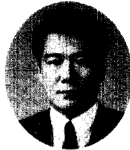
이 교 선*