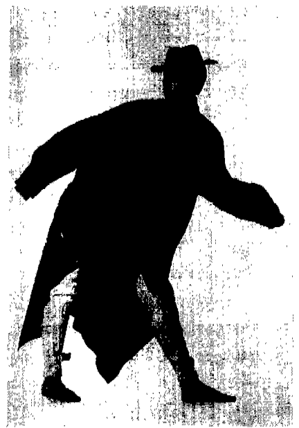
[그림 18] 이세이 미야케, 1982