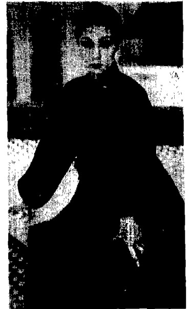
[그림 6] 설윤희, 1990, 「멋」

버선을 모티브로 삼은 이신우 디자인의 의상은 주제가 형태미로 표현된 것으로 버선의 형태를 잘 살리는 동시에 의상의 기능성도 고려한 것이 돋보인다[그림