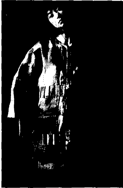
[그림 17] 이신우, 1990, 「멋」