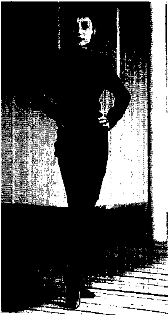
[그림 13] 설운형, 1989, 「멋」