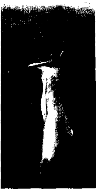
[그림 16] 진태욱, 1987, 「멋」