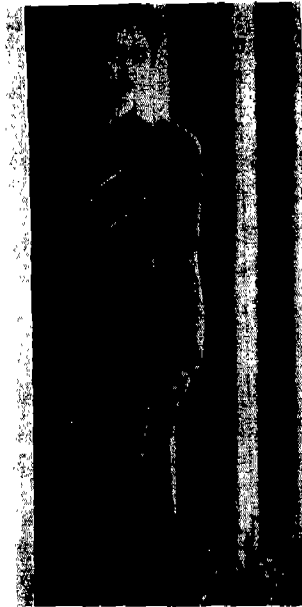
[그림 1] 김동순, 1989, 「멋」