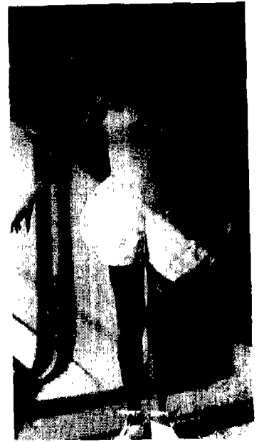
[그림 3] 이신우, 1988, 「멋」