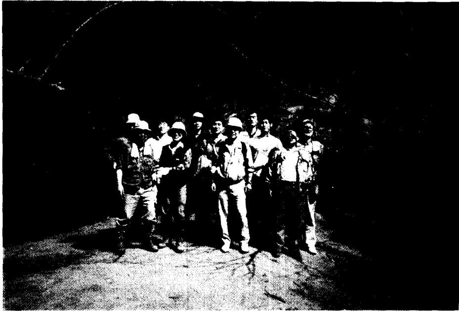
덧붙임: 계룡산 등반사진 1부 (1994년도 봄 직원등반 대회사진)

수해상습지인 굴포천유역의 홍수피해를 경감하기 위한 굴포천 종합치수사업을 방수로사업(한국수자원공사 시행)과 병행하여 1999년 준공을 목표로 현재 사업을 추진중에 있다.