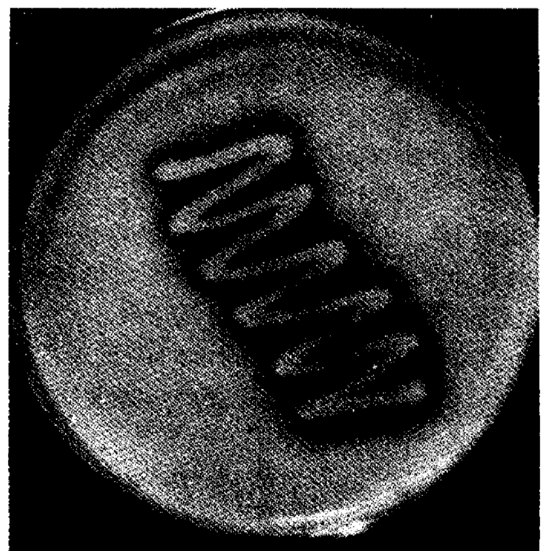
Fig. 1. Clear zone of dextran-degraded area by Flavobacterium multivorum HL-1 cultured on 1.0% dextran mineral salts agar plate by ethanol flooding.

F. multivorum HL-1은 간균 형태로서 그람염색에서 음성반응을 나타냈으며, LB 평판배지에서 48시간 배양하였을 때 노란색 집락을 형성하였고, 덱스트란 최소평판배지에서 배양하여 에탄올을 가하였을 때 균