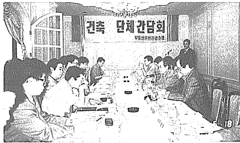
건축3단체 간담회 광경