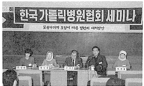
봄 세미나에서, 패널토의

의료의 질향상을 성취하는 일은 의료계의 당면과제인 동시에 윤리적 요구이다. 총체적 질관리를 성공적으로 이끄는 데는 환자의 기대에 부응하는 고객중심의 경영, 조직의 이익을 위해 최선을 다할 수 있는 훈련된 팀이 요구되며 의료기관의 TQM에서는 의사의 적극적이고 능동적인 참여가 필요하다.