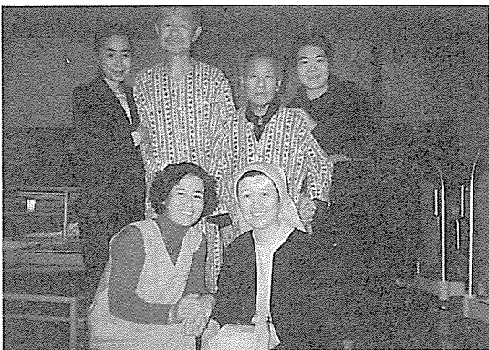
성가복지병원 호스피스 병동에서, 일본간호사들