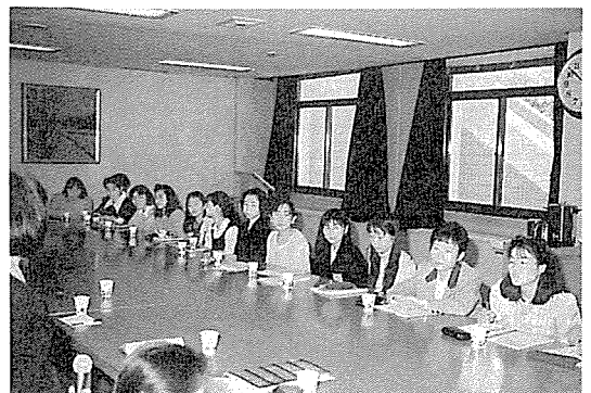
일본 간호학생들의 임상실습 평가회