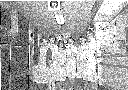
일본 간호사들이 연수를 마치고