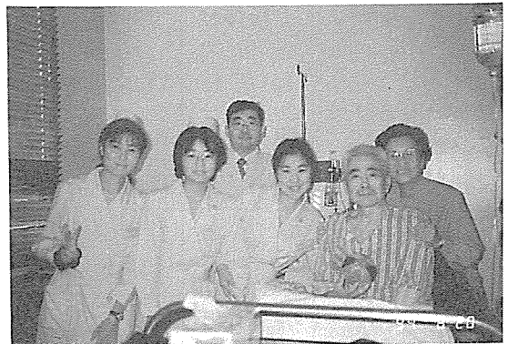
호스피스 연수중인 일본간호사들