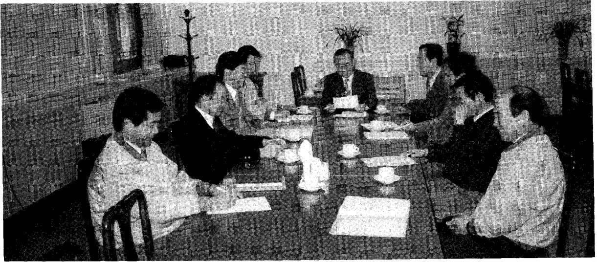
제6차 편집 및 학술위원회