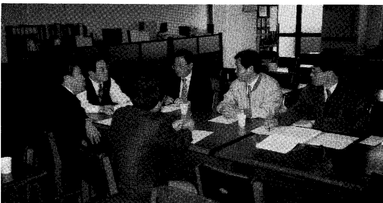
수리시설 현대화 및 보강분과위원회

제3차 수리시설 현대화 및 보강 분과위원회가 '94. 11. 19(토) KCID 사무국에서 위원장(허유