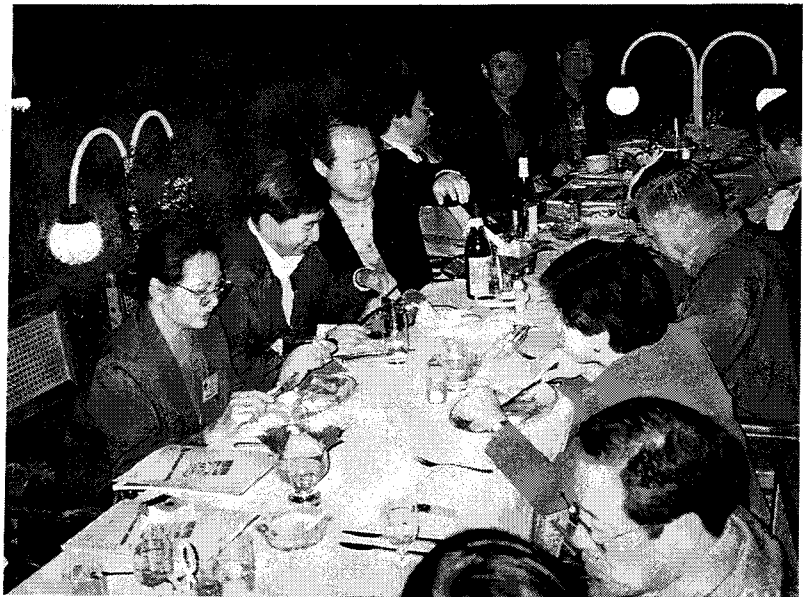
우리위원회 초청 만찬-아시아지역대표들과 함께