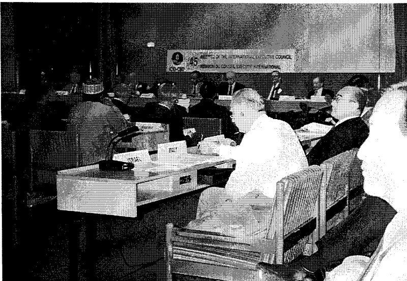
ICID 제45차 집행위원회