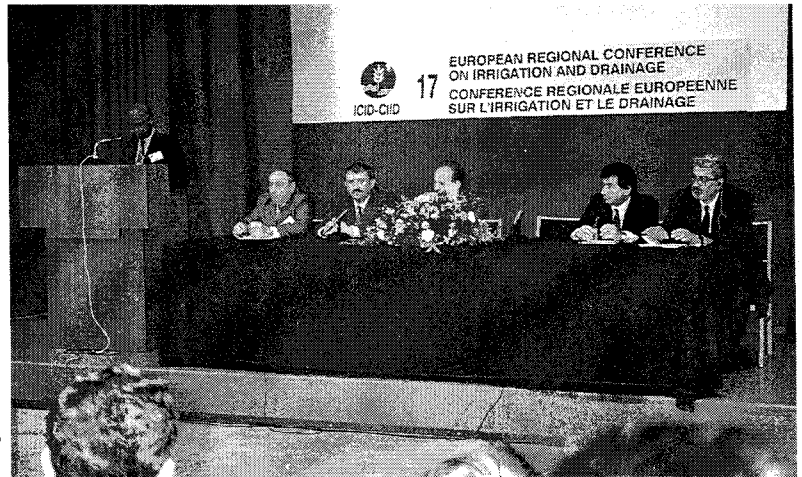
제17차 유럽지역회의 - Mr.Shahrizaila Abdulah ICID 회장이 인사말을 하고 있다.