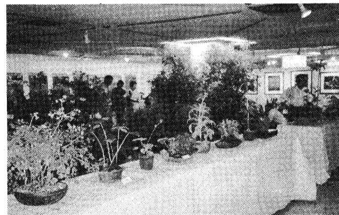
◇ 한국의 멸종위기 식물이 사진으로, 실제식물로 전시됐다.

지난 3~7일 5일간 세종문화회관 제1전시실에서는 사단법인 한국식물원협회 주최로 「우리식물 및 사진전시회」가 열려 눈길을 끌었다.