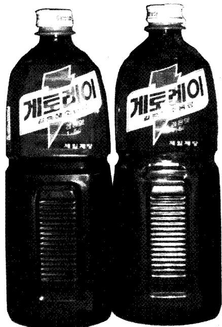
제일제당이 새롭게 선보인 사각형 모양의 PET용기

롯데칠성이 최근 기존 PET병의 3분의1 용량인 500ml 짜리 소형 PET병에 담긴 펩시콜라 · 칠성사이다를 선보였으며, 제일제당은 얼마전 사각형 모양의 PET병에 담긴 게토레이를 출시했다.