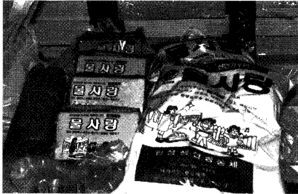
남경포리머가 개발하여 시제품으로 생산, 각종 제품에 적용중인 분해성 필름