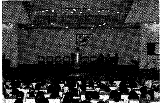
▲ KIDP는 지난 4월 30일 전국 경제인연합회 회관에서 외국유명 디자 이너를 초청, 산업디자인 세미나를 가졌다. 사진은 국제 산업디자인 협회장인 Mai Felip 씨의 강연 모습이다.

상공자원부 주최, 산업디자인포장 개발원 주관으로 금년 10월 5일부터 13일까지 KIDP 전시장에서 열리는 94국제산업디자인교류전에 대해 지 난 3월 14, 15일 양일간 독일 프랑크 푸르트에서 열린 국제산업디자인 협회 이사회에서 국제전으로의 개최