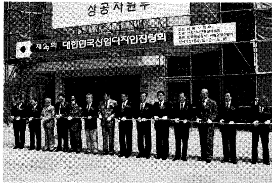
◀ KIDP는 지난 5월 2일 국내 주요 관료인사들이 함께 한 가운데 제29회 산업디자인 전람회 개막식을 가졌다.

공인전문회사 대표, 국제 관련 전문가 등이 강사로 초빙될 설명회의 자세한 내용에 대해서는 KIDP교육연수부 연수1과로 문의. (TEL:708-