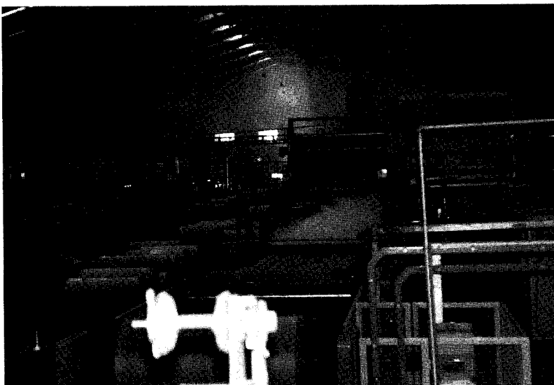
▼골판지 원지로 상자를 가공 생산하는 라인

태림포장은 새로운 도약을 위해 세계최고의 설비라인을 1만4천평규모의 시화 3공단에 설치하고 제1공장의 3색플렉소홀더클루어 2대와 제2공장의 1800mm폭 골게이터1대를 제3공장으로 이전하였으며 이를통해