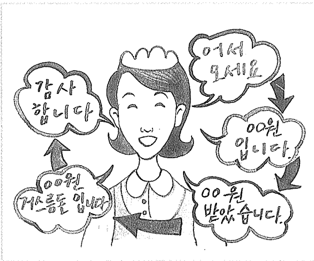
판매의 기본용어를 정확히 실행한다.