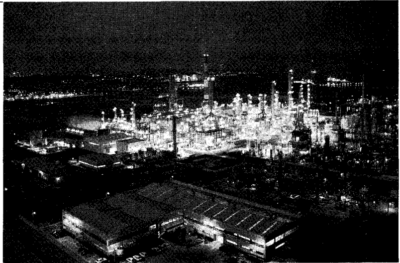
(세계적으로 가장 경쟁력있는 정유회사로 도약하기 위해 시설과 경영의 질적고도화를 추구하고 있다)