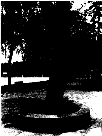
껍질이 왕성한 자가치유현상, 죽은 줄기는 처치해야 한다. 1988. 5. 원광대학교구내