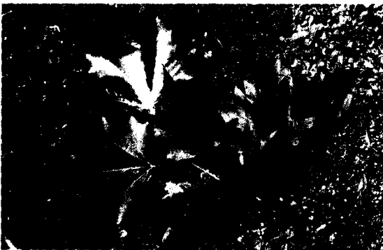
런던플라타너스의 잎. 결각이 더 깊다. 1988. 7. 독일 mainau 식물원