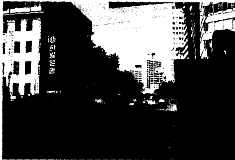
플라타너스 가로수 1975. 9. 23. 서울명동입구