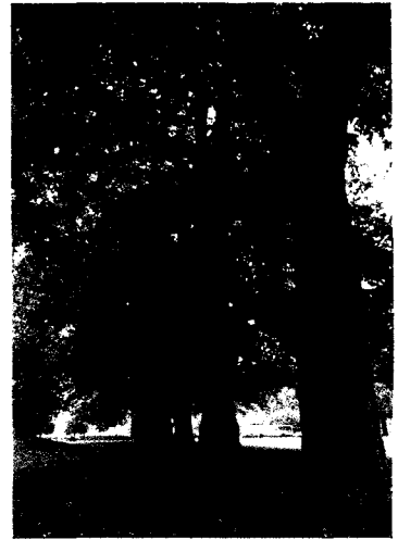
미국플라타너스의 장엄한 미. 미국 조지아주 1988. 8.