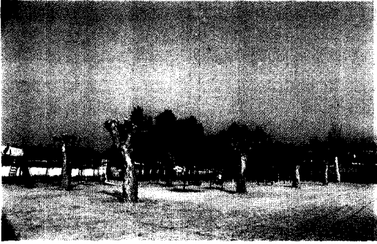
강하게 전정된 플라타너스. 1992. 11. 15. 충북 괴산. 청안국민학교