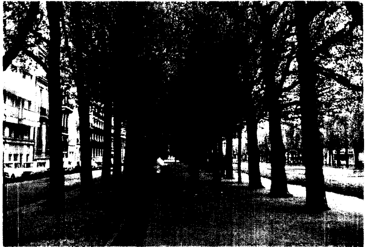
플라타너스와 파리의 시민들 1978. 5.

동양계플라타너스( P. orientalis )는 영어로 Estern Plane (동양계라는 뜻)으로 또 독일 명칭 Morgenlandischer Platanus도 역시 동양(또는 근동) 플라타너스란 뜻으 가지고 있다. 그 반면에 미국플라타너스