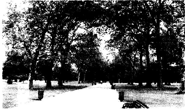
공원의 플라타너스. 1991. 8. 1 런던하이드 파크