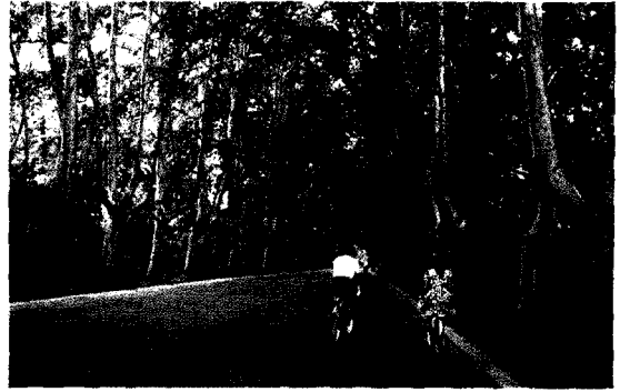
아름다움의 극치. 1988. 7. 28. 중국 남경시내

너스과를 형성하고 있는 점은 좀 이상한 특성이라고 할 수 있다. 그리고 수종들이 지리적으로 멀리 격리되면서 북반구에 분포하고 있는 점에 관하여 고생물학자들은 플라타너스속 수목들이 2대식물에 속하는 것으로 보기도 한다. 플라타너스과의 수종의 역사를 추적하고 있는 생물학자들에 의하면 지금으로부터 약1억년전 백악기(白堊紀 또는 백아기 白亞紀)의 후반 무서운 공룡이 우글거리고 있었던 시대에 플라타너스의 조상이 시작된 것으로 믿고 있다. 플라타너스과에 속하는 수종은 그 형태적특성이 서로 매우 유사하다는 공통점을 지니고 있다. 이것은 피나무속(Tilia)의 내용과 일맥상통하는 것이다. 즉 피나무에는 많은 종류가 있지만 잎의 모양이 라던가 열매와 포(苞)의 구조적 생김새가 비슷하다는 것이다. 플라타너스도 잎과 열매를 보면 누구나 쉽게 플라타너스과에 소속되리라는 것을 알 수 있다. 엽병의 아랫