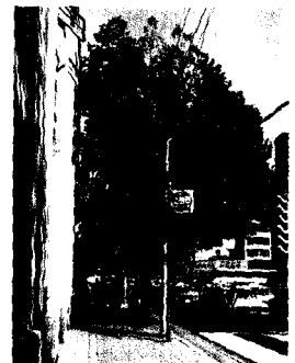
플라타너스. 건축물에 너무 접근해 있다. 1975. 9. 23. 서울 을지로 입구