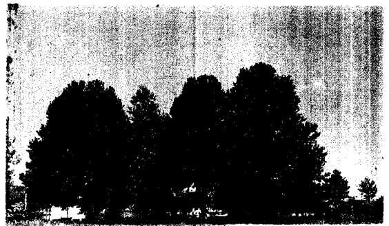
전형적인 플라타너스의 수형. 1972. 8. 25. 서울대 농대운동장