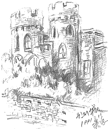
▲ 원저성. 런던에서 서쪽으로 약 50km 떨어진 원저시에 있다. 역대 왕들의 권력과 영광의 날들을 엿볼 수 있는 위풍당당한 석조성이다.

통에 대한 존경이고 사랑이다. 자신들이 지켜오던 것을 함부로 버리지 않는다는 그들만의 자존심과 용기이기도 하다. 웨스트민스터 사원은 에드워드 참회왕이 천년 전에 지은 것이다. 시의 서쪽에 있기 때문에 서쪽의 대사원이란 의미로 웨스트민스터란 이름이 붙었다. 1066년 노르망디공 윌리엄의 대관식을 시작으로 수세기에 걸쳐 왕의 대관식이나 장례식, 그리고 결혼식 등이 그곳에서 거행되었다. 가늘고 긴 색색의 스테인드글라스가 가득 채워져 있는 뾰족한 고딕식의 이 건물에서, 우리가 알고 있는 찰스황태자와 다이애너비도 결혼식을 했었다.