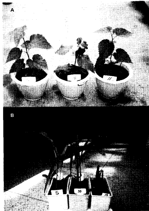
Fig. 1. A. Freezing injury of ice nucleation active bacteria to mulberry seedlings for 3 minutes at -2^{\circ}\text{C} .

蠶業試驗場 圃場에서 秋期伐採 후에罹病뽕나무로부터 總 36개 細菌을 分離하여 각 細菌懸濁液( 10^8 cells/ml)의 凍結溫度를 측정하여 본 결과, -10^{\circ}\text{C} 以上에서 凍結하는 菌株은 12개였으며 그중에서 -5^{\circ}\text{C} 以上에서 凍結하는 菌株은 2개로 SE9316은 -3.0^{\circ}\text{C} 에서 SE9338는 -4.6^{\circ}\text{C} 에서 凍結하였다(Table 1). 生物檢定에 있어서는 -5^{\circ}\text{C} \sim -10^{\circ}\text{C} 사이에서 凍結되는 菌株에서는 일정한 傾向을 볼 수 없었으나 -5^{\circ}\text{C} 以上에서 凍結되는 菌株에서는 토마토, 옥수수, 뽕나