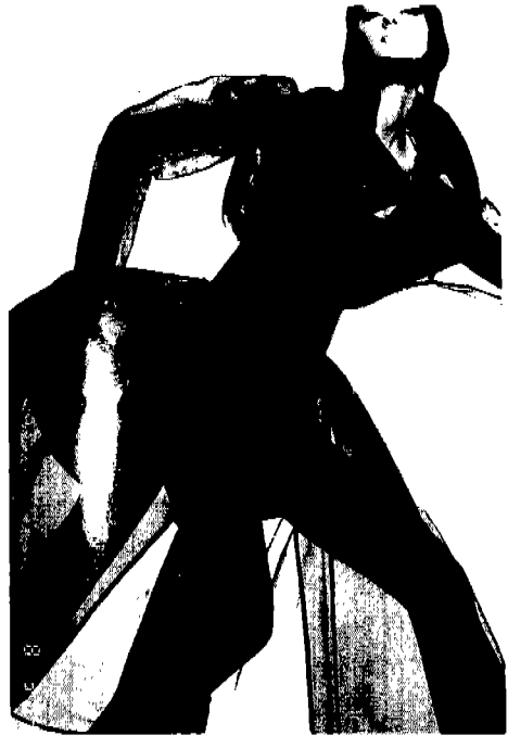
[사진 3] Claude Montana, Vogue (U.S.A.), 1992년 3월, p. 209.

이러한 소개, 성숙 단계에 이른 비치는 얇은 천을 사용한 부드럽고 자유스러우며 흐르는 듯한 스타일은 1987년 봄에 새로 등장한 패션 경향으로, 밀라노의 조지오 아르마니, 돌체와 가바나, 로메오 질리로 부터 시작되어 92년과 93년에 걸쳐 그 성숙기에 이르렀다고 할 수 있다. 이러한 복식의 가벼움에 부수적인 현상으로 1992년 3월 Karl Lagerfeld는 Chanel의 전통적인 진주 장신구를 대신 크리스탈과 프라스틱으로 만든 see-through 장신구 [사진 4]로 대체하여, 크리스탈