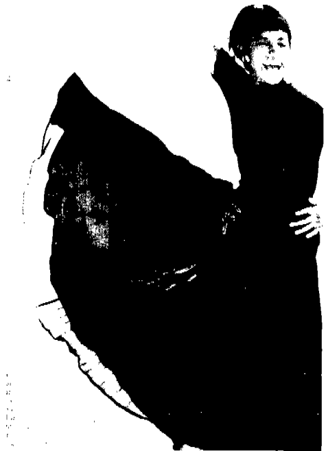
[사진 2] Claude Montana, Vogue (U.S.A.), 1988년 12월, p. 319.