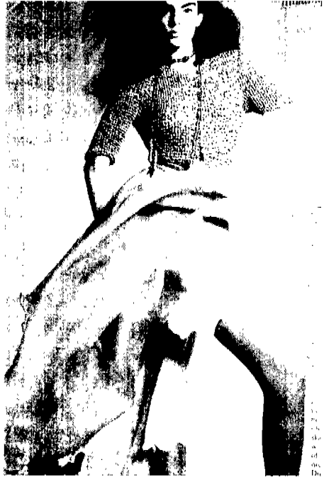
[사진 1] Giorgio Armani, Vogue (U.S.A.), 1988년 1월, p. 162.

이는 87년 봄에 나타난 밀라노의 부드럽고 자연스러운 스타일의 시작을 알리고 있다. 이는 그 전의 몸에