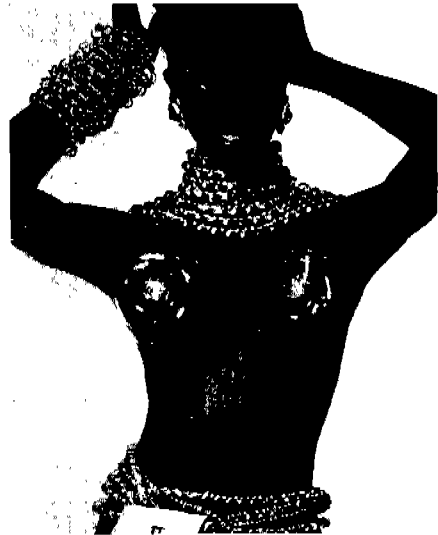
[사진 4] Chanel, Vogue (U.S.A.), 1992년 3월, p. 209.