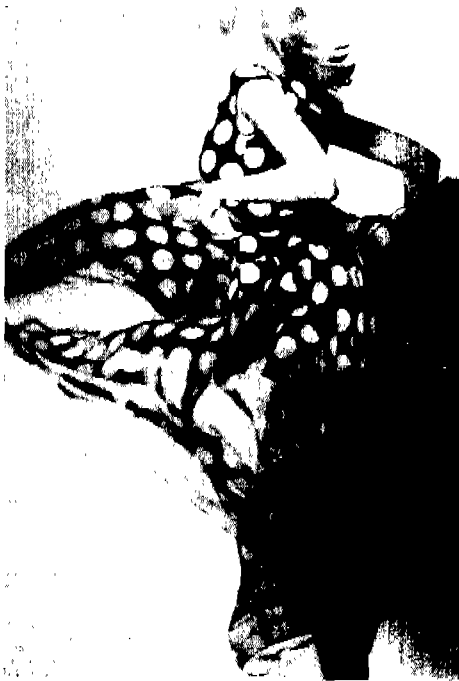
[사진 5] Isaac Mizrahi, Vogue (U.S.A.), 1991년 11월, p. 255.

덜할수록 가볍다는 느낌을 부여한다. 디자인의 조형상품의 여유를 부여하기 위해서는 몸에 끼지 않아야 한다. 이를 위해 여유분을 넉넉히 주며, 주름(개더링, 셔링, 플리세)등의 디자인 요소를 사용 [사진 6]한다. 세째, 전체적인 실루엣은 슬림형과 중형으로 나타나며 상의보다 하의가 더 많은 면적 [사진 7]을 지닌다. 네째, 비치는 소재의 사용으로 인한 신체의 노출을 감소시키기 위해 여러겹을 겹치는 방법을 취한다. 두겹내지 세겹으로 옷을 구성한 경우 각기 다른 색을 사용하여 표현되는 경우도 있다. 네째, 복식과 주변 환경과의 관계를 들통의 분류에 따라 살펴보면, 주변 환경과 외곽선은 열린 상태이며, 배경과 평면 통합을 이루며, 비한정적인 형태의 속성을 지닌다. 다섯째, 부수적으로 수반된 특징으로 메이크 업은 연하고 약해지며, 장신구의 경우 금속 장신구 대신 투명한 크리스탈이나 플라스틱이 사용된다. 비치는 소재의 사용으로 속옷의 가시성이 증가하여 속옷의 디자인 장식 요소 51) 가 강하