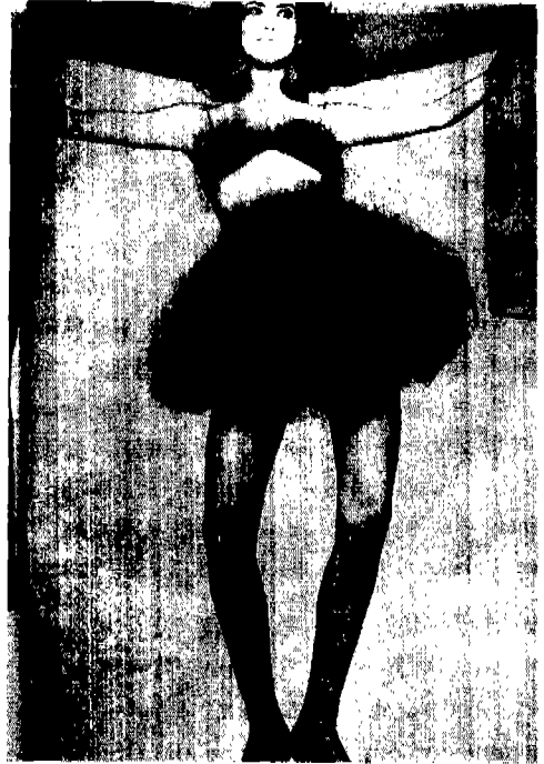
[사진 6] Dolce & Gabbana, Vogue (Italy), 1992년 2월, p. 269.

90년대초 복식에서 나타난 가벼움으로 정의되는 외적 형식은 첫째, 그 사용된 소재에 의해 성격이 가장 명확해진다. 복식에서 '가볍다'라는 의미는 '무겁지 않다'의 의미로 이는 직물의 무게보다는 시각적인 투시도와 관련이 깊다고 하겠다. 예를 들어 아주 가볍지만 불투명한 실크 주름 드레스를 입었을 경우 '가벼운'보다는 '로맨틱한, 여성적인'으로 그 성격이 나타난다. 즉, 유연하고 부드럽고 비치는 소재의 특성 [사진 5]이 중요하다. 비치며 얇은 오간자, 쉬폰, 머슬린, 레이스, 망사 및 경량감있는 직물로 이루어진다. 그러나, 레이스의 경우 레이스의 구멍의 크기가 커질 경우, 이는 그물을 연상케하여 가볍다라는 느낌보다 물에 젖어 축 늘어진 듯한 연상작용으로 가벼움보다는 무겁다라는 느낌이 강해진다고 하겠다. 둘째, 복식의 가벼움은 '여유있는'과 관련이 깊다. 신체에 부착되는 정도가