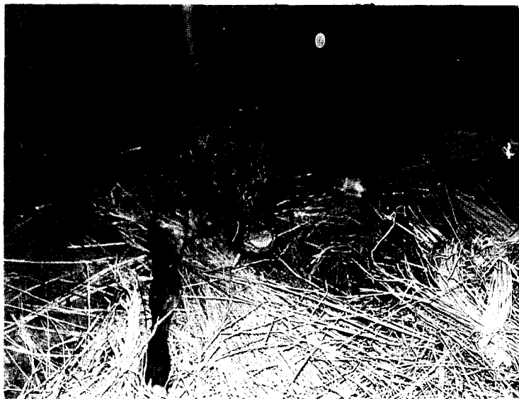
Fig. 2. A Korean native calf born after transfer of an IVM-IVF embryo to the uterine horn of a female Aberdeen Angus.

* B: Blastocyst, XB: Expanded blastocyst, HB: Hatching blastocyst