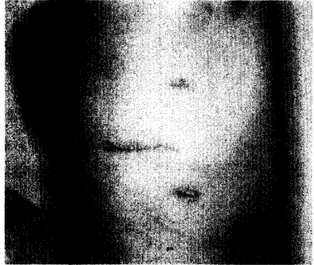
그림 2. 작업창 개흉의 피부 절개 모습

수술 방법은 이중관기관내 삽관(double lumen endotracheal tube)을 시행하고 측와위(lateral decubitus position)를 취했다. 종양으로의 접근을 용이하게 하기 위해 후부 종격동 종양의 경우에는 환자를 약간 앞으로 기울이고 전부