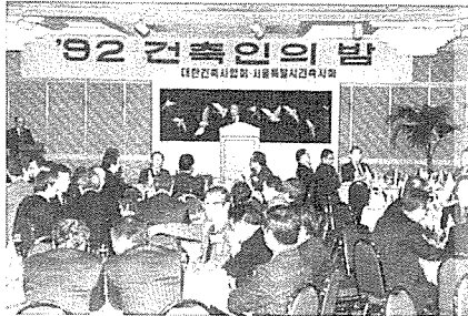
'92 건축인의 밤 행사 광경

어려운 여건 속에서도 건축을 사랑하는 마음과 건축인으로서의 긍지로 온갖 어려움을 감내하면서 우리나라 건축문화 진흥과 협회 발전에 기여해 오신 여러분께 심심한 감사를 드린다 며, 오늘 이순간 새롭게 전열을 가다듬어 새해로의 힘찬 발돋음을 하자」고 강조하였다.