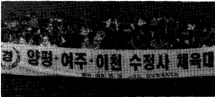
사진 : 경기남부 3개지부 단합 체육대회를 마치고

일시 : 1993. 5. 9 장소 : 양평군 강상면 강상체육공원 참석인원 : 여주, 양평, 이천 회원 50명과 가족 내용 : 회원단합 체육대회, 협회 남부지역 활성화 방안 논의