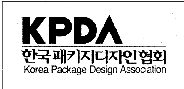
◀ 협회 로고

창립 이래 15년간 포장디자인의 꾸준한 창작활동으로 산업계 포장디자인 발전의 숨은 일꾼으로 자리했던 협회는 패키지 디자인의 활성화를 통하여 건강한 포장문화의 창달과 장차 우리나라 패키지디자인계의 균형적인 발전을 위하여, 또한 급변하는 국제적 추세에 발맞추기 위하여 전회원의 의사를 적극 반영하여 협회 공식명칭을 변경하게 되었습니다. 아울러 앞으로 '서울'이라는 지역적인 협회 명칭보다는 '한국'이라는 명칭을 사용하여 한국을 대표하는 협회로 거듭나고, 협회 이미지를 대내외적으로 보여주기 위해 혼신의 노력을 다하고