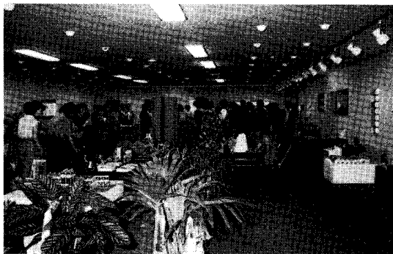
◀ 협회 창립전