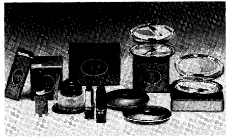
▲ 피어리스의 「오베론」 화장품

또한 (주)피어리스(대표 조동매)도 소비자 포장 부문에서 여성화장품인 「오베론」 메이크업을 출품하여 아시아스타상을 수상했다.