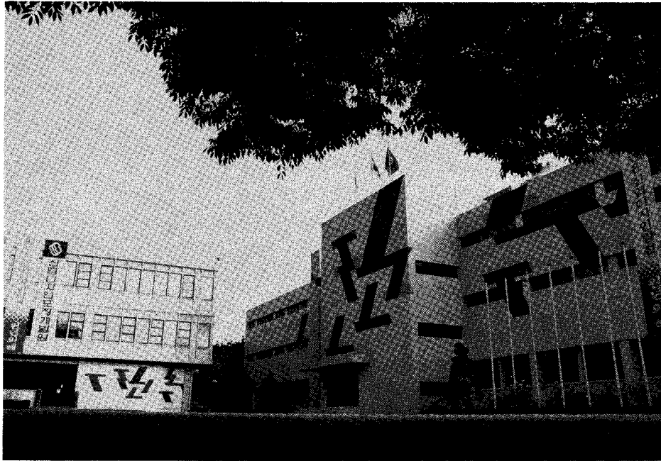
▲ 새롭게 단장한 산업디자인포장개발원 전경