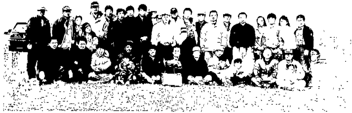
▲광주·전남지부의 대행회원 뉴시대회

그리고 전기기술향상 발전을 위하여 우수산업체인 금성계전(주) 청주공장을 방문하여 시설견학 했다.