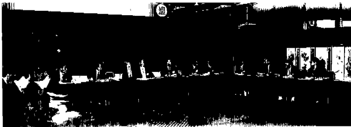
▲제16차 이사회 장면