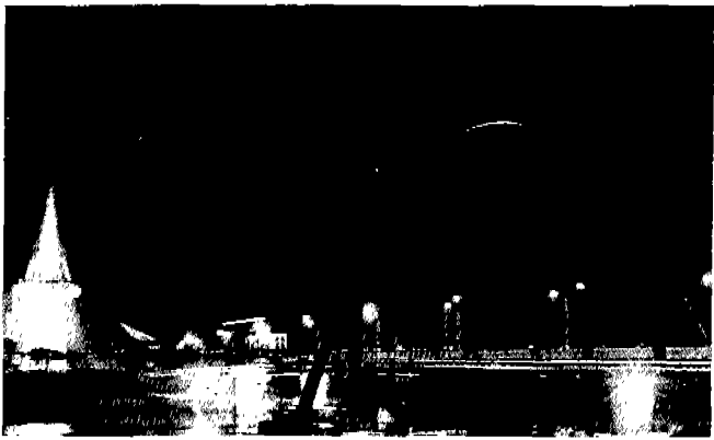
▲ 새로운 도약에의 길'을 시각적으로 형상화하여 지혜로운 과거를 바탕으로 현재와 미래를 잇는 한줄기 빛의 의미로 표현하고 있는 한빛탑

개발도상국에게 우리의 실상을 보여줌으로써 그들에게 발전의 의욕과 희망을 주고 각국의 전통기술과 현대과학을 조화있게... 21세기를 향한 새로운 도약에의 길을 모색하고 인류에게 21세기의 비전을 제시, 조화있는 발전을 도모