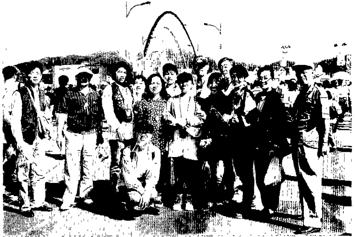
▲ 대전 EXPO 관람 기념사진

협회는 지난 9월 11일부터 12일, 18일~19일 2회에 걸쳐 직원들의 복지증진과 소양교육 일환으로 대전 EXPO '93박람회장을 견학했다.