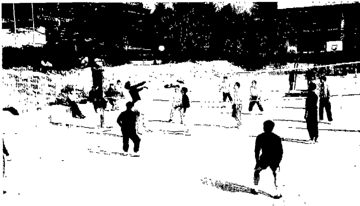
▲안산협의회와 안성협의회의 배구시합 장면