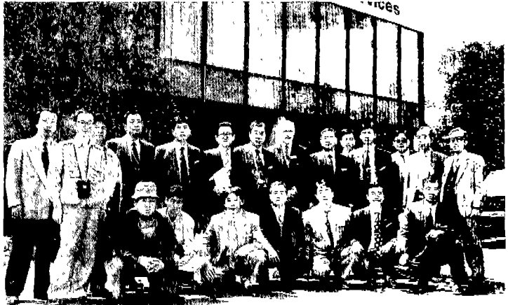
▲호주 퍼시픽 파워 에너지 서비스 방문기념