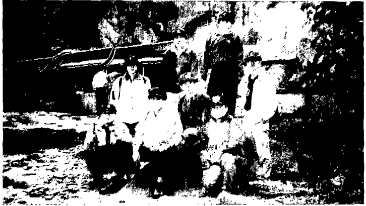
▲월악산 마애불 앞에서 기념촬영

이날 행사는 정부시책 호응과 직원들의 복지증진과 체력단련을 위해 건전한 정신과 육체를 단련하는데 역점을 두고 실시됐다.