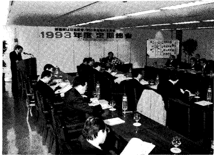
〈1993년도 에너지협의회 정기총회 광경〉

이날 총회를 마친 회원들은 앞서 이사회가 열렸던 방에 마련된 조출한 다과회에 참석하여 예상시간 30분을 넘기는 환담의 자리를 가졌다.