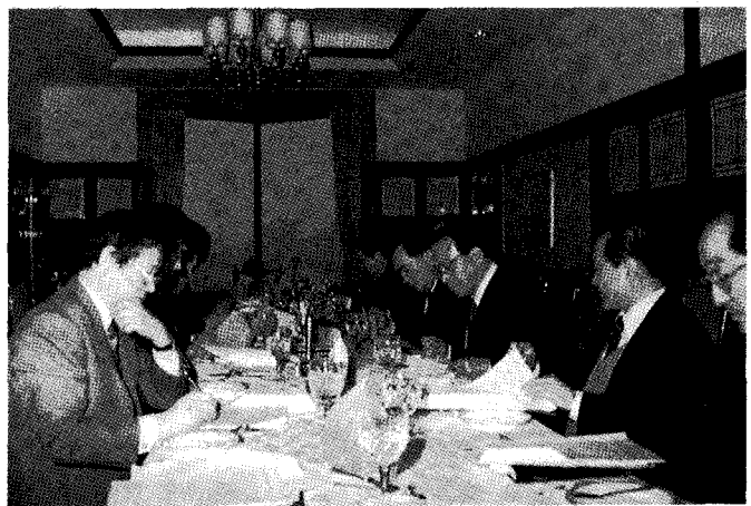
〈에너지협 제11차 기술자문위원회가 쌍둥이빌딩 회의실에서 열렸다〉