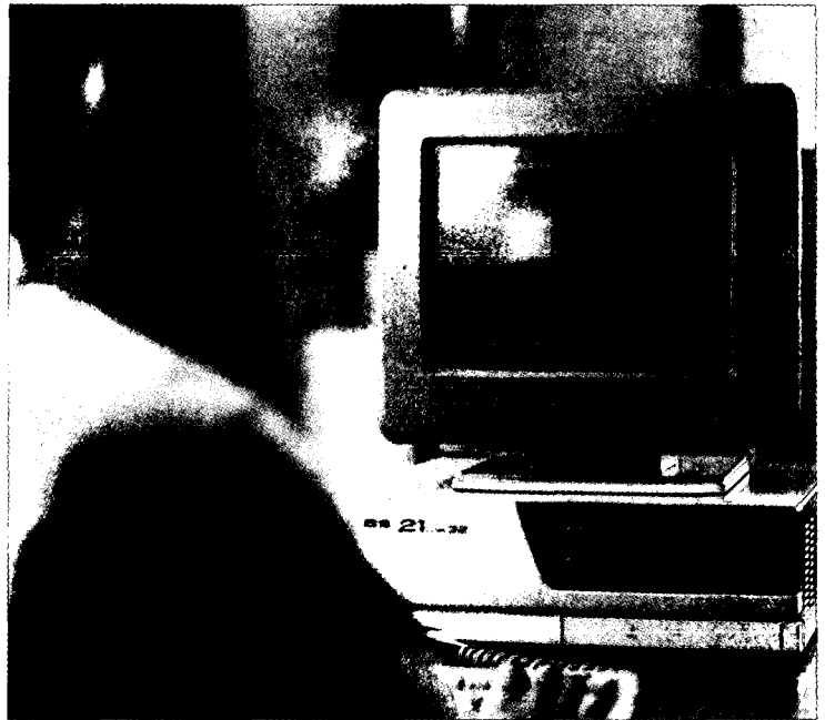
<인물정보는 변동이 많고 즉시성이 요구되는 DB이다.>

인물정보를 검색하는 방법은 대상인물의 인적사항(성명, 주소, 학력, 경력, 기관 및 직위 등)을 조건검색형태로 찾아보는 키워드방식을 이용