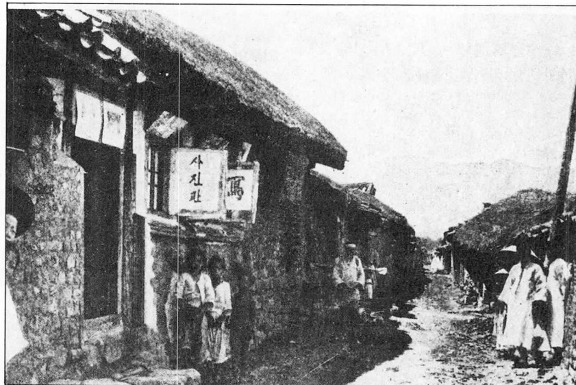
위) 한글간편이 눈길 끄는 '사진관' 사진.

1925년 4월 전조선 민중운동대회를 무산시킨 경찰당국의 사진기자에 대한 취재방해는 우리나라 최초의 사진취재 탄압사건으로 기록