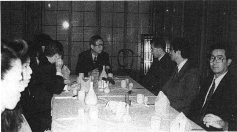
출국전날 연수단 일행은 저녁식사를 함께하며 연수소감과 한국의 풍습등에 대해 담소를 나누었다.

이들 연수단 일행은 출국에 앞서 서울 구로공단 내 중앙산업보건센터도 방문하여 수도권에서의 센타운업 현황 등에 대해 듣고 일본의 산업보건 현황과 비교해 보며 많은 의견을 나누후 서울시내 관광을 마치고 귀국하였다.