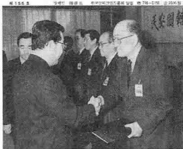
우수방산업체... 연구개발... 금성정밀 기술선도... 태산정밀 풍포혁신... 삼성중공업 경쟁협력... 동명중공업 수출시장 개척... 금연방산사