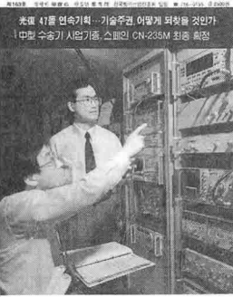
光復 41를 연속기획... 기술주권 어떻게 되찾을 것인가 나 中형 수송기 사업기종, 스페인 CN-235M 최종 최종