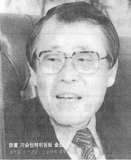
防産 기술협력위원회의 술문 제2회 조기경보/전장감시 심포지엄