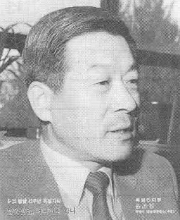
제2회 항공우주 심포지엄 제5회 항공우주 심포지엄