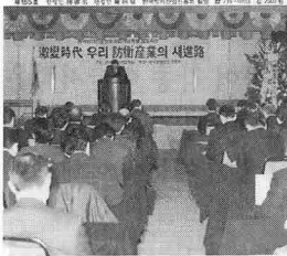
방산학회 창립기념 첫 심포지움 성황... - 격변시대, 우리 방위산업의 새 길 GLAS-830M, 그룹 연구개발 대賞 수상 · 인터뷰 / 금성정밀 安致濤 사장