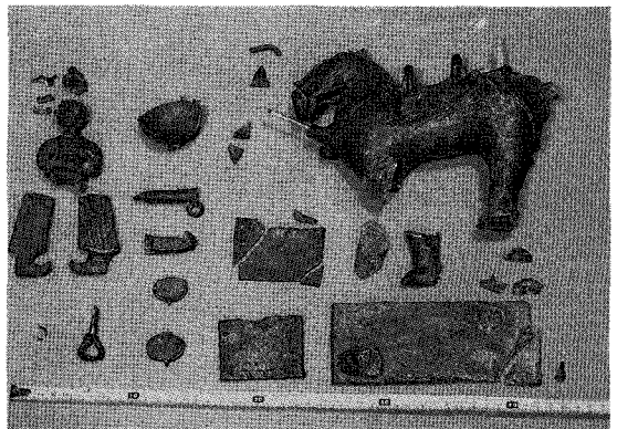
사진 2. 완전 해체 모습