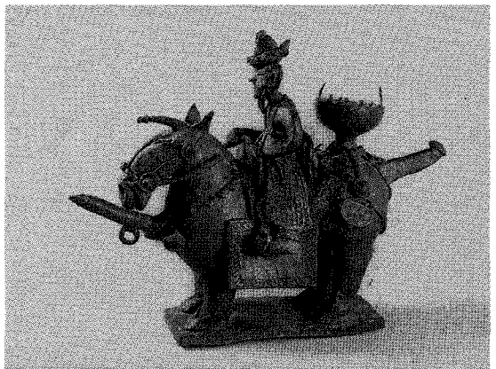
사진 3. 복원처리 후 모습 (처리기간 1977. 11~1978. 2)