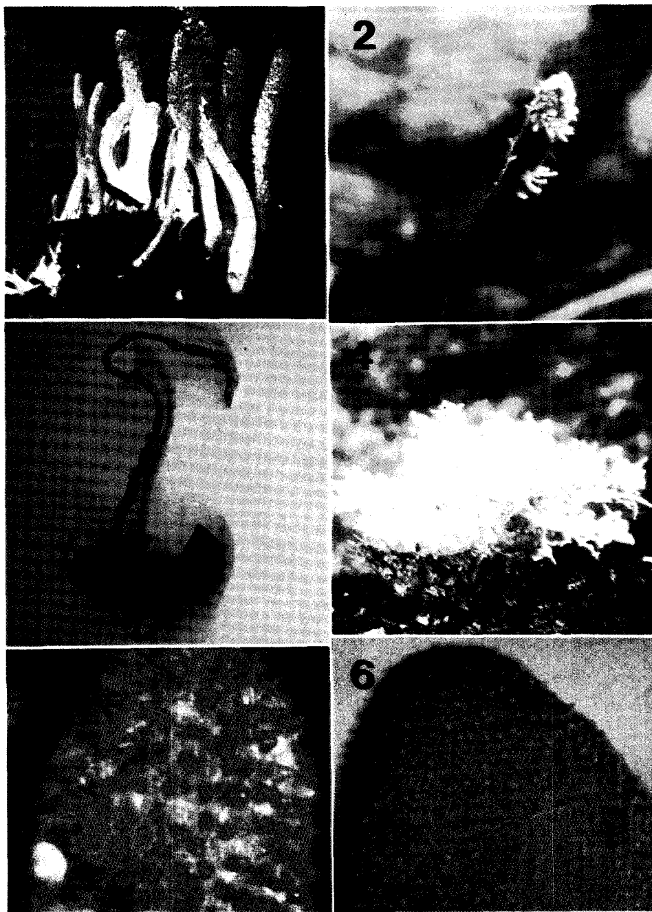
Photo. 1. 22 stromata on pupae(4 cm×2 cm) caused by C. militaris .

Photo. 2. Different fruiting bodies formed on stroma of C. nutans .