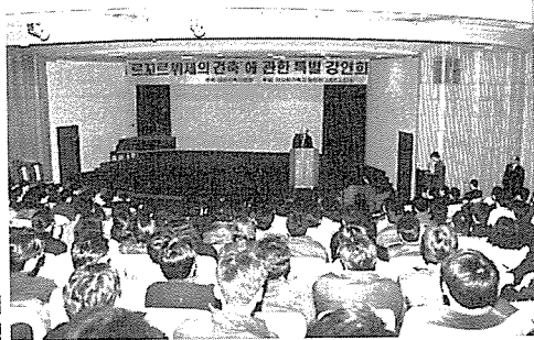
르꼬르뷔제의 건축 강연회 전경