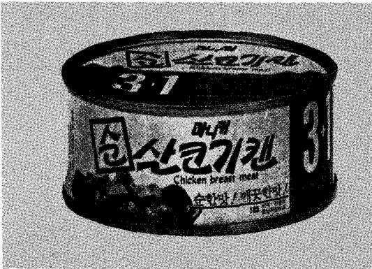
• 중량: 100g, 원터치 캔

이미 40여종 닭고기 가공품과 15종의 생계류를 생산·판매해오고 있는 닭고기 전문회사인 천호인티크레이션(주)(대표 이계조)에서 신제품인 “마니커 산살코기 캔”을 선보일 예정이다.