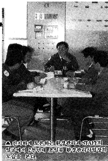
▲진지하게 토론하는 환경관리과(STAFF)의 일대에서 2천년대 초인류 환경관리사업장의 모습을 본다.