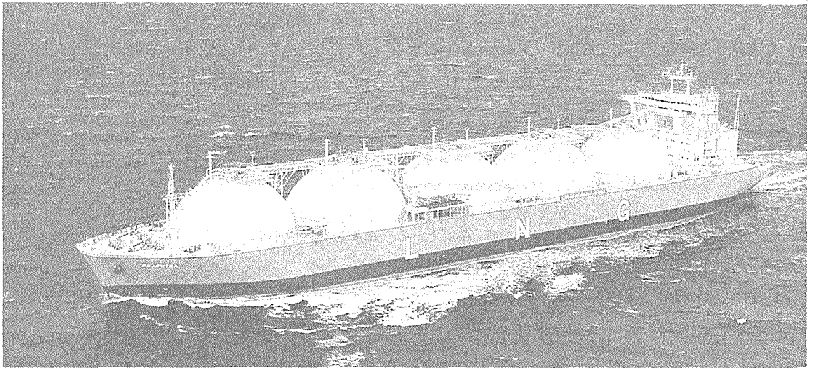
LNG 탱커의 신속이 활발히 이루어지고 있음.