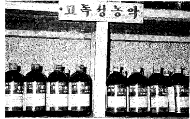
농약의 안전성을 확보하기 위해 취급제한기준을 강화했다.

하여 고독성 농약, 보통독성 농약 및 어독성 농약과 수질오염성 농약에 대한 취급제한기준을 강화하여 1992년 1월 11일 고시하고 1992년 3월 1일부터 시행키로 하였다.