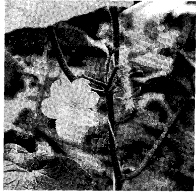
안전성 확보와 환경오염 방지를 위해 관련법규를 개정, 강화했다.

농약사용으로부터 농작물의 안전성을 확보하고 환경오염방지를 위하여 농약에 대한 잔류성시험을 강화하는 한편 농약제조업 및 수